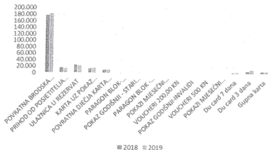
Grafikon – pregled prodanih ulaznica za 2018. i 2019. godinu